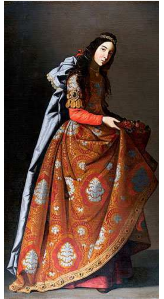
Las santas son uno de los iconos del legado de Zurbarán; él y los miembros de su taller pintaron muchas, que posteriormente compraban en América. Y, como todo gran éxito, también fueron muy copiadas. 'Santa Casilda' (1635). Óleo sobre lienzo que puede contemplarse en el Museo Thyssen-Bornemisza de Madrid.

Entre todos los artistas del barroco, probablemente sea Zurbarán en el que tanto el público como la crítica han reconocido un lenguaje más personal, propio y característico. La originalidad de sus obras radica en que reflejan una estética que atrapa y subyuga, con un carácter trascendente que hunde sus raíces en una primorosa destreza técnica, una rotunda presencia y un lenguaje que llega fácilmente al espectador. Sus pinturas persuaden por su absoluto realismo, pero también por el modo íntimo y cercano con que representa tanto los objetos y el espacio que estos ocupan, como por la imponente presencia de sus protagonistas. Así definen hoy los expertos en Historia del Arte al genio pacense, al que su padre envió en 1614 a la capital hispalense para aprender el oficio. Allí coincidiría con los pintores Francisco Pacheco, Juan de Roelas y Francisco Herrera El Viejo , y sus coetáneos Alonso Cano y Diego Velázquez. Y justo allí, en tierras sevillanas, corazón económico de la España del siglo XVI, cuyas iglesias y ricas mansiones rebosaban entonces de obras pictóricas y escultóricas, aprendió, probablemente, a esculpir, policromar estatuas y dorar retablos. Eso lo convirtió en el más escrupuloso y auténtico intérprete del pensamiento religioso de su tiempo, aportando una manera real de asimilar las maravillas de la creación, ya fueran