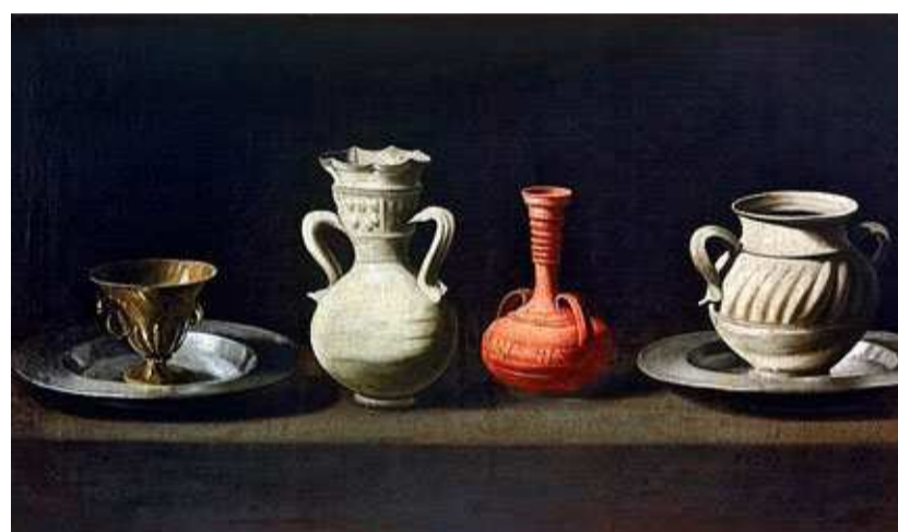
El hijo de Zurbarán, Juan, que murió muy joven, era también un excelente pintor, como muestra el lienzo que hay sobre estas líneas 'Peras en cuenco de porcelana' (1645). A la izquierda, 'Bodegón con cacharros' (1650-1655), uno de los pocos en los que trabajó su padre. Procede del Museo Nacional de Arte de Cataluña (Barcelona).

tal y llenas de dignidad, se construyen con solidez, dando la sensación de estar transfiguradas por su fe, situadas en un plano de realidad entre lo divino y los humano.