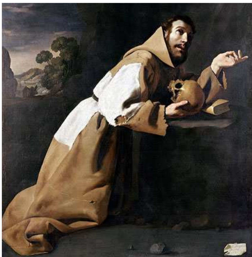
'San Francisco en meditación' (1639). Pertenece a la colección permanente de la National Gallery de Londres. El artista firmaba algunas de sus obras, como ésta y 'San Serapio' (1628) -en la primera página del reportaje-, en un papel pinchado con un alfiler que pintaba sobre el lienzo.

Así, un total de 63 obras, en su mayoría de gran formato, integran esta singular exposición, distribuidas en siete salas del museo Thyssen, siguiendo un orden cronológico y atendiendo también a la naturaleza del encargo por el que fueron ejecutadas. Con este planteamiento, el visitante encontrará espacios dedicados a las comisiones de las comunidades religiosas junto a otros donde se contemplarán piezas individuales destinadas a la devoción privada, incluyendo en