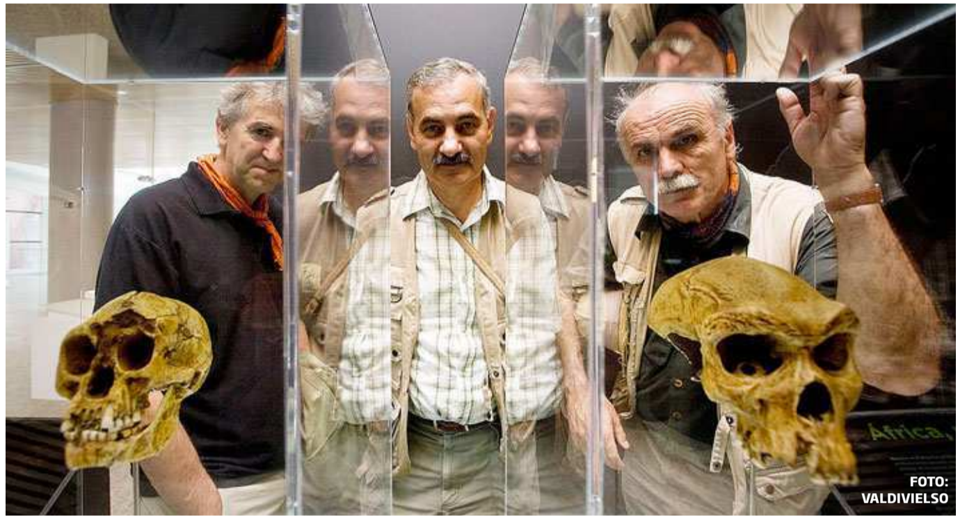
Los tres codirectores de las excavaciones de Atapuerca. Juan Luis Arsuaga, José María Bermúdez de Castro y Eudald Carbonell.

años... pero siempre hay hallazgos interesantes. Si encontramos algún fósil humano ya sería maravilloso porque estamos trabajando en niveles en los que nunca han aparecido restos de homínidos».