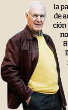
Emiliano Aguirre Miembro de la Real Academia de Ciencias

Una cata de prospección junto a la pared rocosa mostró un nivel de antigua entrada y ocupación con copiosos fósiles humanos, muy prometedores, de 800 kiloafios para cuando llegue la excavación, pero faltan décadas.