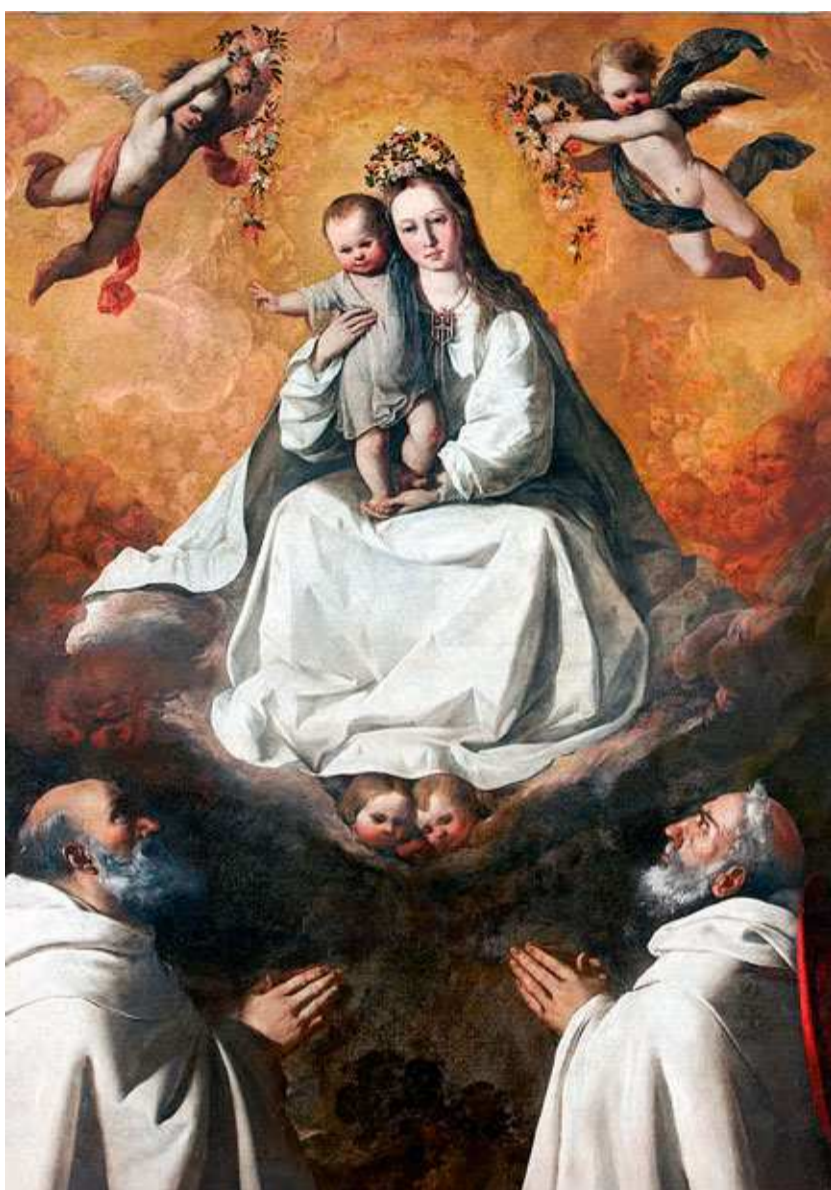
Las Vírgenes del pacense lucen cara de niñas y adolescentes, a pesar de vestir con ricos ropajes propios de mujeres adultas, y sus ojos tienen siempre una mirada perdida en el infinito. Así lo pone de manifiesto este cuadro, 'Virgen de la Merced con dos mercenarios' (1635-1640), que pertenece a un coleccionista privado.