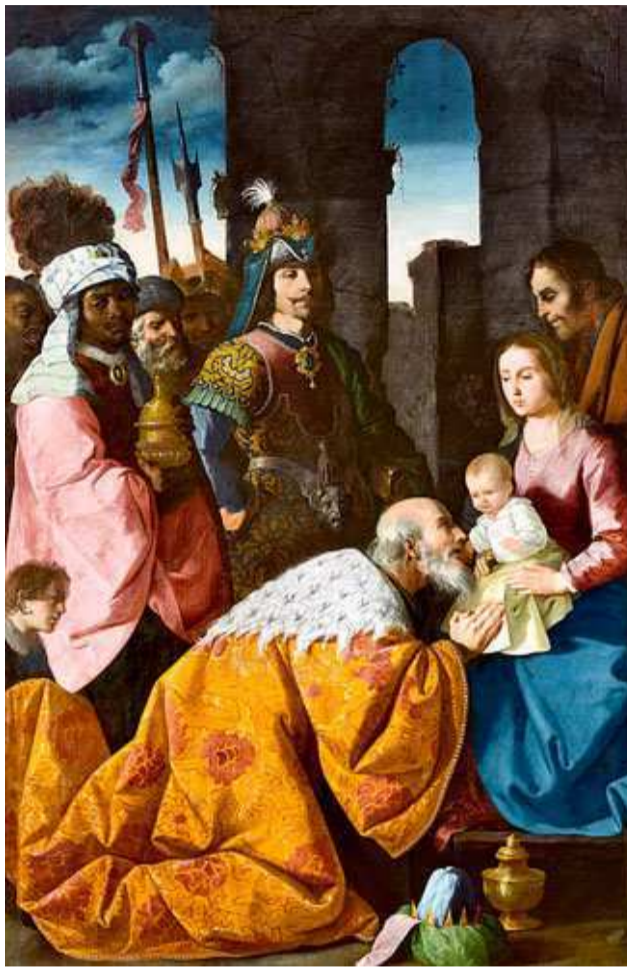
El pintor pacense era tendente a deformar las perspectivas, algo que puede apreciarse en esta 'Adoración de los Magos' (1638-1639), que forma parte de la colección permanente del Musée de Grenoble (Francia). Esta pieza es un buen ejemplo de otra de las características del genio: su padre era comerciante de telas, de ahí su gusto por darles vida y convertirlas en protagonistas de los cuadros, con el realismo de sus volúmenes.