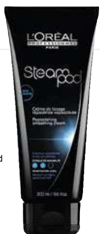
Steam pod creme de lissage