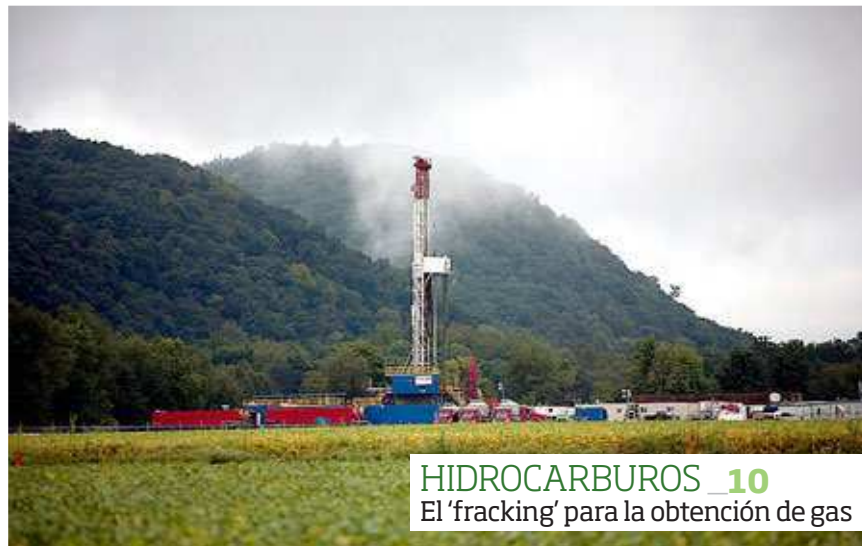
HIDROCARBUROS 10 El 'fracking' para la obtención de gas