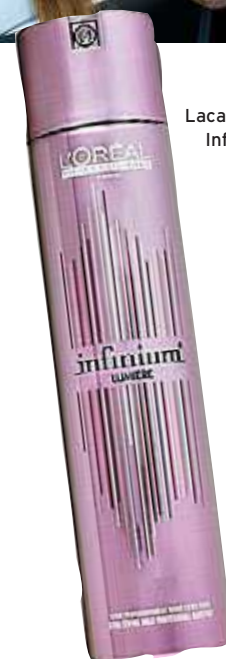
Laca L'Oréal Infinium

Un clásico. Levantarse por la mañana y hacerse una coleta es una cosa, pero recogerse el pelo con una simple goma también tiene su arte y esta temporada este socorrido peinado vuelve con más fuerza que nunca. Da igual como lo hagas: baja, alta, de lado... la clave está en mantener siempre un pelo lacio, brillante y bien apretado, por lo que tendrás que utilizar las planchas para empezar a trabajar el cabello. Si quieres que tu pony tail dure todo el día, pulverízala con un poco de laca.