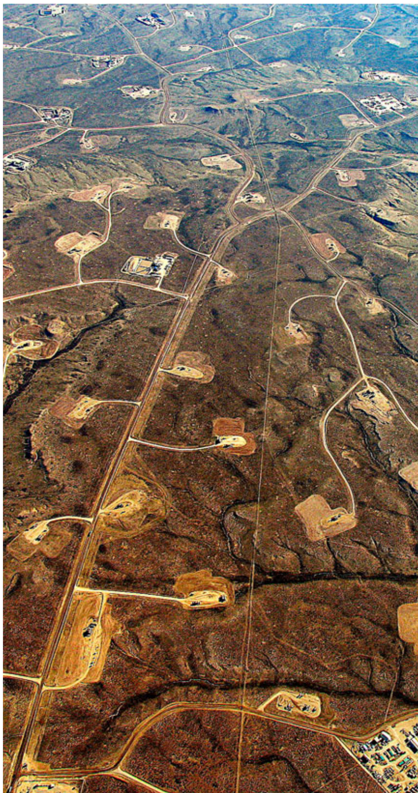
Vista aérea de un terreno del estado de Wyoming, en Estados Unidos, en el que se aprecia cómo ha cambiado el paisaje después de las actuaciones de 'fracking'.

contaminación acústica e impactos paisajísticos, entre otras.