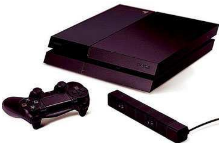
PLAY STATION 4 28 Sony desvela su secreto y muestra el diseño de su nueva consola