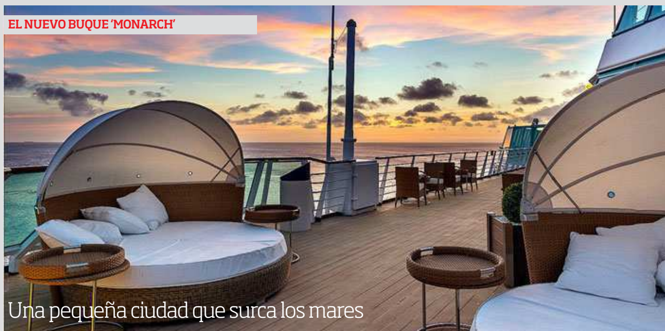
Una pequeña ciudad que surca los mares

El Monarch es el nuevo buque insignia de la empresa de cruceros Pullmantur y es la mejor opción para descubrir la cultura, historia, naturaleza y belleza del Caribe; una forma diferente de viajar para conocer a gentes de todo el mundo y rodearse del típico ambiente festivo caribeño en régimen de todo incluido. El barco cuenta con cuatro restaurantes y siete bares y una gran variedad de actividades en torno a las piscinas de cubierta. Además, los más deportistas tienen a su disposición un rocódromo, cubierta sport, gimnasio y escuela de submarinismo, que ofrece un curso de iniciación al buceo que se puede completar en alguna isla. Los cruceristas también disponen de solárium, jacuzzi, SPA y salón de belleza y por la noche pueden disfrutar de casinos y discotecas. Puede alojar 2.766 pasajeros y realiza 53 salidas al año, acogiendo a más de 145.000 turistas de todo el mundo.