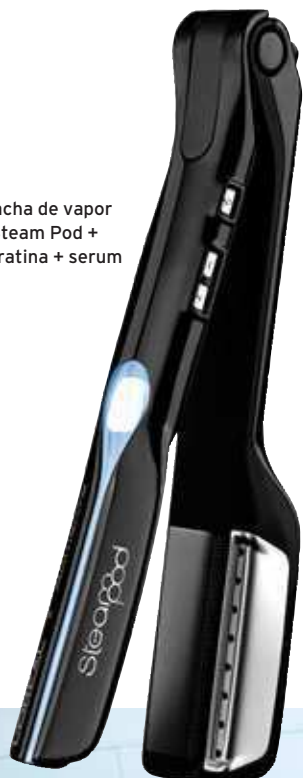
Placha de vapor Steam Pod + queratina + serum