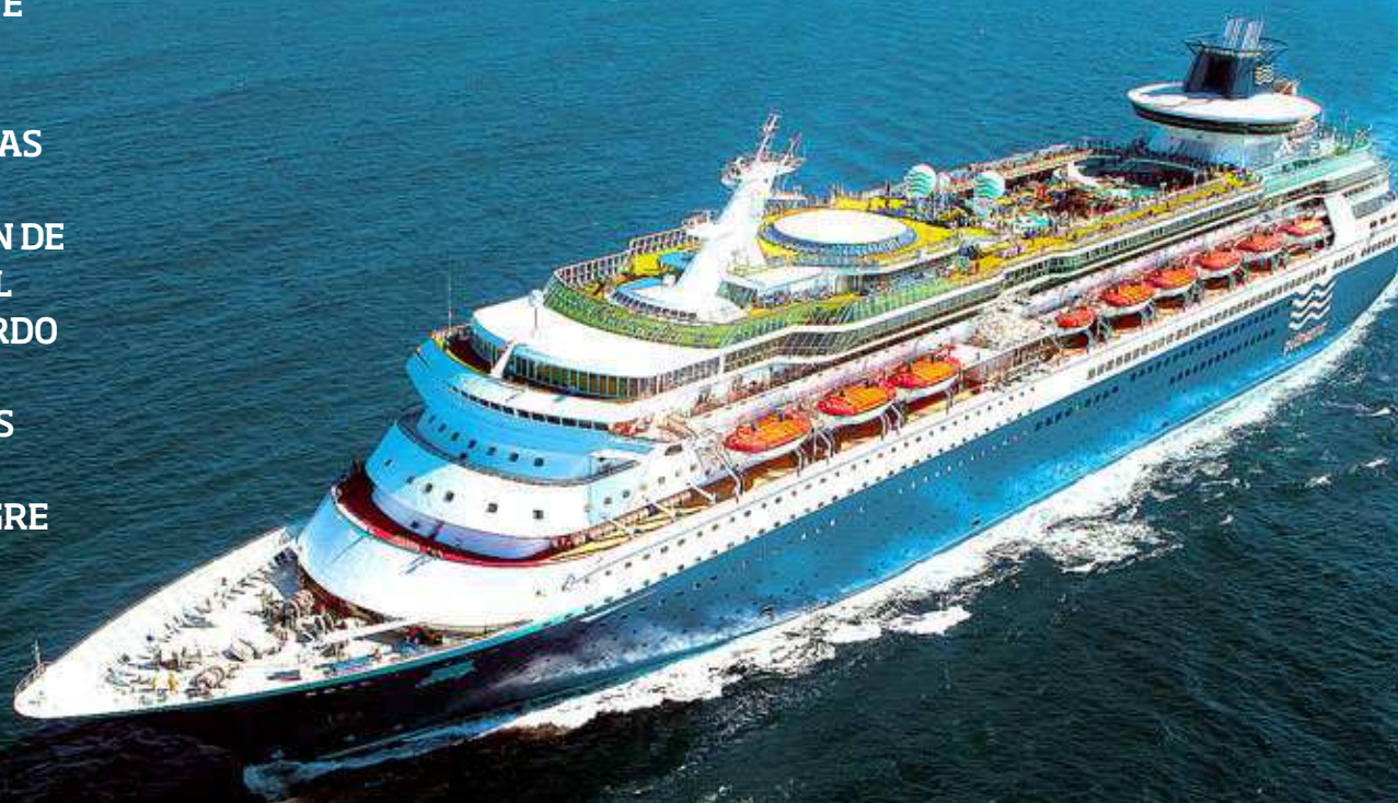
Vista aérea del gran buque 'Monarch', en su travesía por el Caribe Sur y las Antillas.

VIAJAR NO ES SOLAMENTE DESCUBRIR PAISAJES Y PUEBLOS, ES TAMBIÉN INTEGRARSE EN CULTURAS DIFERENTES Y CONOCER TURISTAS QUE PROCEDEN DE TODOS LOS RINCONES DEL MUNDO. VIAJANDO A BORDO DE UN GRAN CRUCERO REVIVIMOS SENSACIONES PERDIDAS Y NOS ABANDONAMOS AL ALEGRE DESCUIDO DEL VIAJE SIN PREOCUPACIONES. PLAYAS DE ARENA BLANCA, INOLVIDABLES ATARDECERES, ISLAS PARADISIACAS Y LAS MÁS HERMOSAS CIUDADES COLONIALES ESTÁN AL ALCANCE DE LA MANO; SÓLO HAY QUE ESPERAR QUE ATRAQUE NUESTRO BARCO.